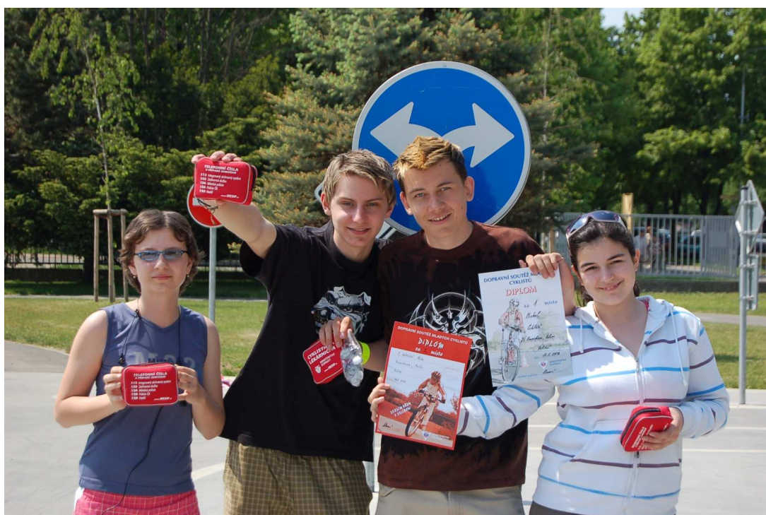
Dopravní soutěž mladých cyklistů – starší kategorie, 2. místo v okresním kole

V tomto školním roce byla přijata jedna žákyně ze 6. ročníku ke studiu na 8 letém Církevním gymnáziu svatě Voršily v Kutné Hoře.