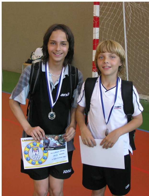
Soutěž ve stolním tenise

1. Kolínská sportovní olympiáda základních škol v následujících soutěžních sportech – atletika, basketbal, cyklistika, florbal, kopaná, plavání, sportovní aerobik, sportovní střelba a stolní tenis. Naše škola získala 4 zlaté, 6 stříbrných a 11 bronzových medailí. Celkově jsme se umístili na 8. místě mezi 17 účastníky. Žáci přistupovali k jednotlivým soutěžím s vysokým nasazením. Mnozí v sobě objevili nadšení a zálibu ve sportech, které nejsou v učebních osnovách.