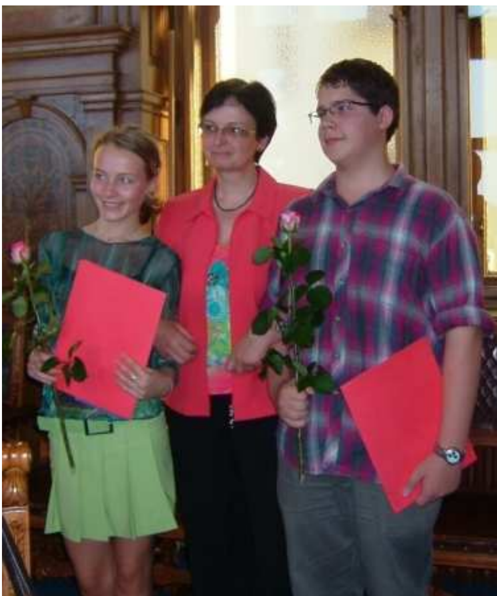
Ocenění nejlepších žáků a studentů Stipendijním nadačním fondem města Kolína

Již desátým rokem pracuje více než desítka dobrovolníků na tvorbě školního časopisu. Žáci se učí pracovat s vlastním textem, s grafikou, počítačovými programy. Domlouvají se na obsahu, neboť ten je stále tím hlavním, proč je o časopis zájem mezi dětmi ba i mezi jejich rodiči.