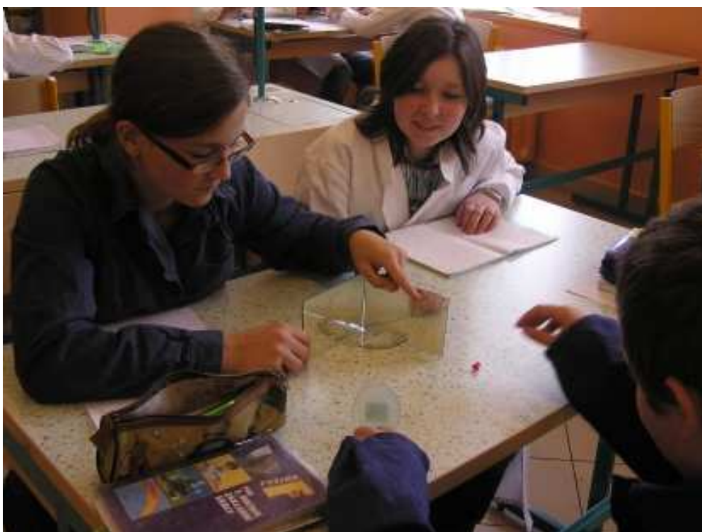
Laboratorní práce v hodině fyziky ve třídě 7.B