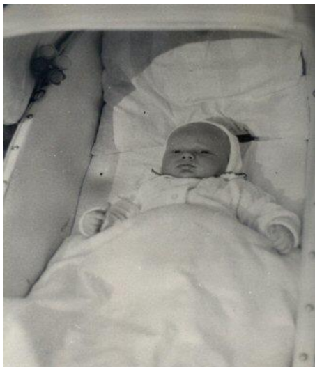
Julča & barča