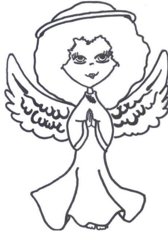
nakreslila Jana Kasanová,

Betlémské světlo se stalo novodobým symbolem Vánoc. Je to plamínek, který skauti rozvázejí do celého světa přímo ze slavnostní mše z Betléma, a posléze putuje napříč Evropou. Do Česka betlémské světlo putuje z Vídně, kde jej rakouští skauti předávají o neděli Gaudete delegacím z celé Evropy. Pro české země jej