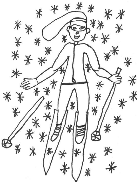
nakreslila Kateřina Hokynářová, 5. A