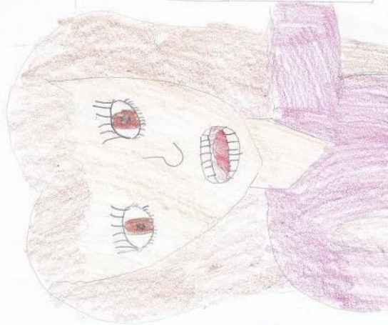
Nakreslila Pavlína Novotná

Jejda Jedna Trojka. Ahoj! Ta Trojka Mí to lazi (Za miz mi úsměv).