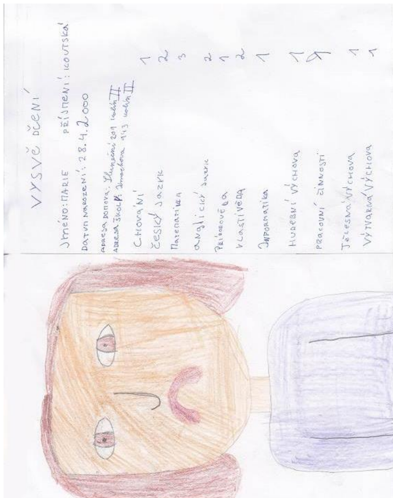
Nakreslila Marie Koutská